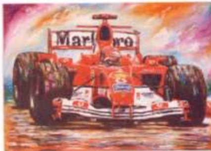
Ferrari Σουμάχερ 2004